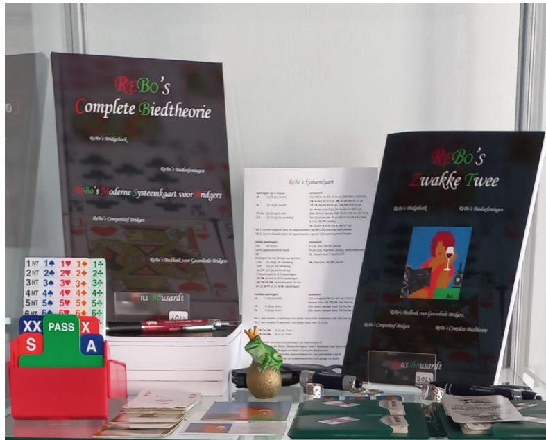
opstelling in de vitrinekast van De Pettelaer