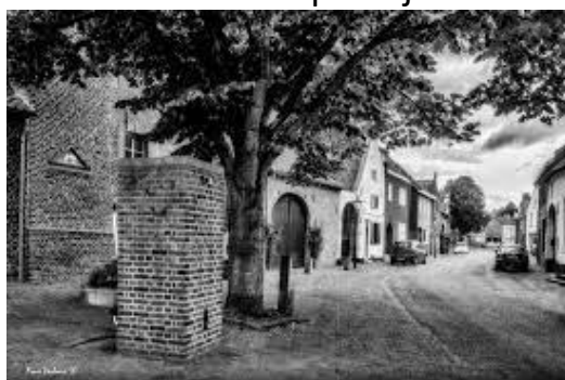
dorpsstraat met waterpomp